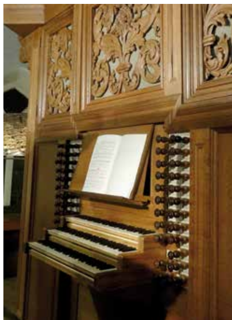
Speeltafel Grote- of Mariakerk Meppel.