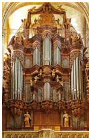
Eule-orgel in de Dom van Halberstadt.

een orgelkalender uit, met op elk blad een mooie orgelfoto en op de achterzijde een uitvoerige beschrijving ervan. Bij deze kalender hoort een CD met muziek van alle twaalf orgel, bij elkaar 75 minuten. De eerste foto in 2017 toont het Eule-orgel in de Dom van Halberstadt - Saksen-Anhalt. De vaste organist laat een enthousiaste improvisatie horen over Joshua fit the battle of Jericho . De trompet erbij maakt er een spetterend geheel van. Daarna klinkt het orgel uit de Dom van Havelberg met Bach en dat uit de Dom van Hildesheim met Reger. Verder zijn nog opnamen te horen uit de jaargangen 2011 en 2013.